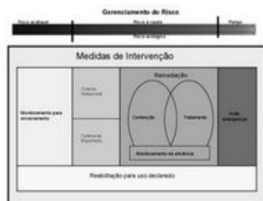
Figura 2: Ações a serem adotadas no gerenciamento do risco.

As técnicas de remediação são classificadas de acordo com seu objetivo: i) técnicas para tratamento (ou descontaminação) e ii) técnicas para contenção (ou isolamento), existindo, ainda, técnicas que podem alcançar os dois objetivos citados. As principais técnicas de remediação são apresentadas no capítulo X do “Manual de Gerenciamento de Áreas Contaminadas”.